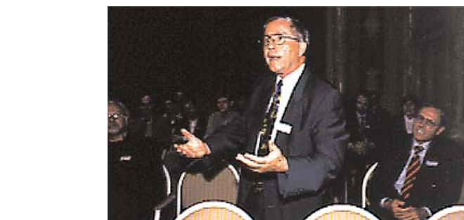
Nationalrat Christoph Blocher belebte das SW-Podiumsgespräch zum Thema politische Werbung.

Die Dienstleistungen der SW werden zunehmend in Anspruch genommen: Bis zu 30 E-Mails mit Anfragen kriegt die Geschäftsstelle täglich. Wichtigste Themen: Löhne und Stellenvermittlung, aber auch Fragen der Ethik in der Werbung und natürlich juristische Probleme werden regelmässig thematisiert. Rund 80 Rechtsauskünfte, etwa zur Hälfte Fragen aus dem Werbevertragsrecht, der Rest aus dem Werberecht, sind bei der SW gege-