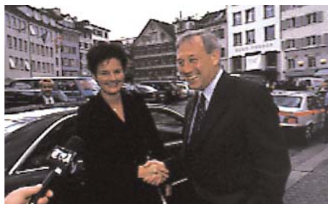
Der Besuch von Bundesrätin Ruth Metzler bei der Mitgliederversammlung gehörte zu den Höhepunkten des Jahres 2000.