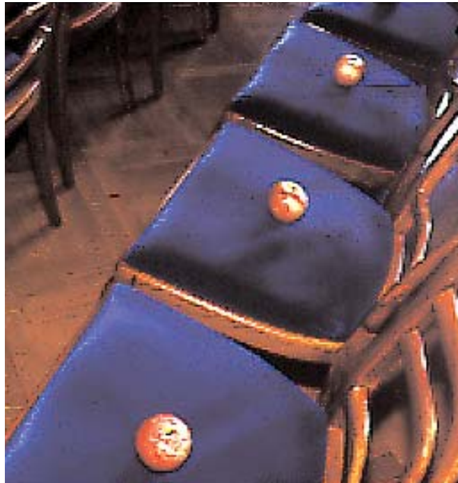
Der Apfel als ultimatives Werbemittel spielte eine herausragende Rolle bei der 75-Jahr-Feier der Schweizer Werbung.

Es ist die Hauptaufgabe der Schweizer Werbung, auf politischem Parkett zu tanzen. Und sie tat es im auslaufenden Jahr mit forciertem Rhythmus. Gewissermassen vom englischen Walzer zum Rap. Dank den hervorragenden Beziehungen des SW-Präsidenten, Ständeratspräsident Carlo Schmid-Sutter, fanden heuer zahlreiche Kontakte mit Politikern und politisch orientierten Organisationen statt. Dass die Themen der Werbung selbst beim Bundesrat ernst genommen werden, zeigte Ruth Metzler anlässlich der SW-Mitgliederversammlung. Die Justizministerin kritisierte die zunehmende Verrohung der Kommunikation im politischen Umfeld und forderte mehr Lauterkeit in der politischen Werbung. Letztere beschäftigt zunehmend auch die Parlamentarier und Parlamentarierinnen. Sie hatten Gelegenheit, anlässlich einer gut besuchten und stark beachteten Podiumsdiskussion das Thema besser kennen zu lernen. Die Veranstaltung in Bern setzte die Serie von Parlamentariertreffen fort, welche regelmässig von der SW organisiert